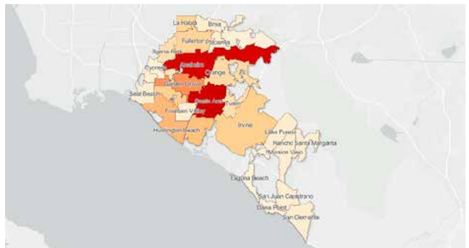
FIGURA 3: ZONAS ROJAS POR CIUDAD EN EL CONDADO DE ORANGE

59