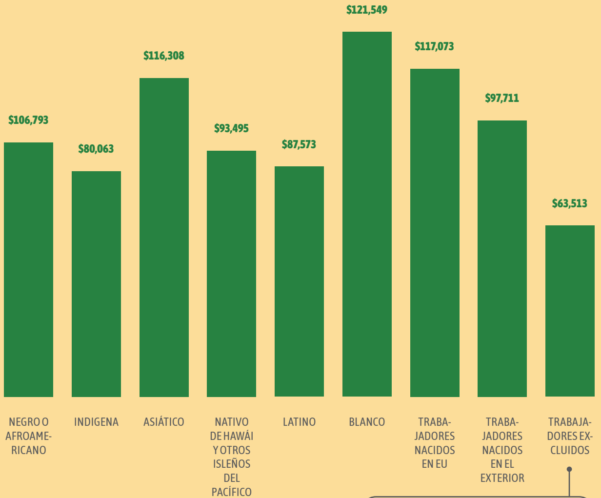
FIGURA 1. INGRESO FAMILIAR PROMEDIO EN EL CONDADO DE ORANGE (2023)